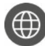
Zona privada de la web

En el funcionamiento normal de la ikastola se utilizan las plataformas digitales que se muestran a continuación. La información más detallada sobre estas plataformas, será facilitada por el tutor o tutora en la reunión por niveles de comienzo de curso.