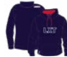
Jersey con capucha

Para la asignatura de Educación Física es obligatorio contar con la ropa deportiva oficial de la Ikastola. Las ropas deportivas entre las que se puede optar son las siguientes: